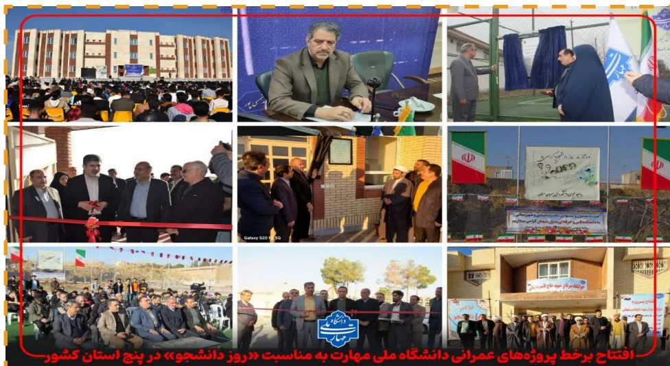
افتتاح برخط پروژه های عمرانی دانشگاه ملی مهارت به مناسبت «روز دانشجو» در پنج استان کشور